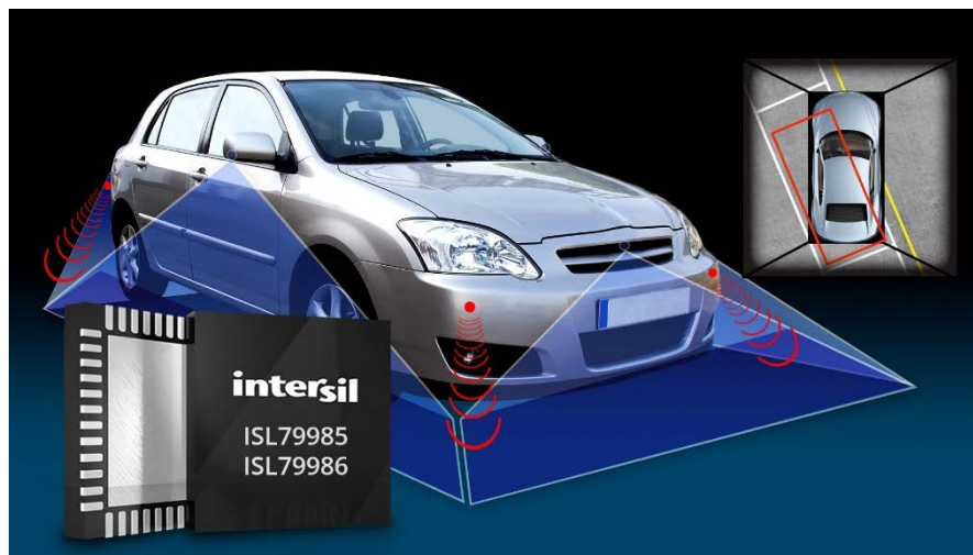
図 3 : ISL7998x 4 チャンネル・ビデオ・デコーダは超鮮明な画像を提供し、ドライバーと歩行者の安全性を向上

サラウンドビュー・モニタとも呼ばれるアラウンドビュー・モニタ・システムは、4 個のカメラから伝送されるビデオ画像を処理し、4 つの画像を単一の鳥瞰映像に合成し、クルマの上方に設置したカメラで撮影したかのような画像を提供する。モニタにより、ドライバーは周囲の対象物に対するクルマの相対的な位置を視覚的に把握でき、クルマの操作や駐車が容易になる。Infinity Research によれば、アラウンドビュー・モニタ・アプリケーションだけの 2018 年までの年平均成長率は 33 パーセントとなる。